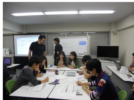
PR セミナー・リーダーセミナー